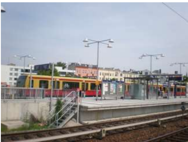
Bild: S-Bahnhof Charlottenburg – erkennbar sind einige der Besonderheiten der S-Bahn Berlin: Stromschiene, 96 cm hohe Bahnsteige, metroähnliche Fahrzeuge, städtisches Umfeld

Verkehrlich gesehen bedient die S-Bahn Berlin hauptsächlich den Stadt- und Stadtumlandverkehr. Zusammen mit der U-Bahn, zu der an vielen Stationen umgestiegen werden kann, bildet sie das Schnellbahnnetz und damit das Rückgrat des Metropolenverkehrs.