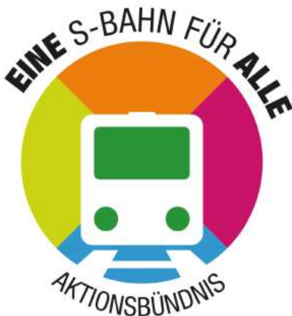
Logo des Aktionsbündnisses “Eine S-Bahn für Alle”